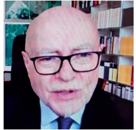
Professor Dr. Dr. Di Fabio.

Professor Dr. Dr. Di Fabio erläuterte als ehemaliger Richter des Bundesverfassungsgerichts in einem Fachvortrag seine Sicht zur Rolle des öffentlichen Dienstes in unserer Verfassungsordnung und nahm Bezug zu den Beschlüssen des Bundesverfassungsgerichts, die