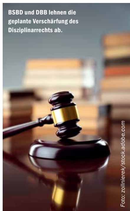
BSBD und DBB lehnen die geplante Verschärfung des Disziplinarrechts ab.

Der Deutsche Beamtenbund hat sich klar gegen das geplante neue Gesetz positioniert, und ich denke und hoffe,