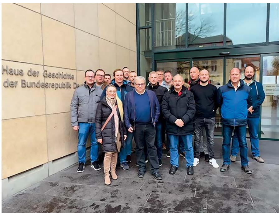
Die Seminargruppe vor dem Haus der Geschichte in Bonn.