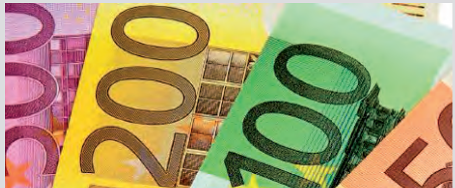
Wie immer dreht sich alles um das liebe Geld.

Konsequenz der damaligen Entscheidungen ist heute ein Altersdurchschnitt von weit über 50 Jahren speziell in den Laufbahnen des mittleren Dienstes.