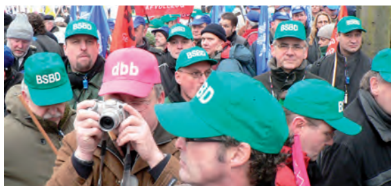
Die Kolleginnen und Kollegen stehen hinter den berechtigten Forderungen der Gewerkschaften und werden sich nicht mit Almosen abspesen lassen.

Diese Einschätzung bewegt sich fernab jeglicher Realität. BSBD -Vorsitzender Anton Bachl hat diese Provokation