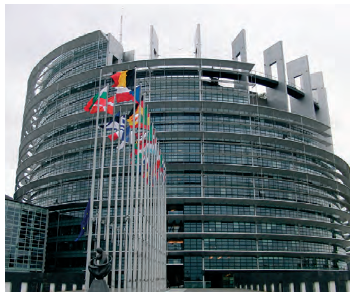
Der Europäische Gerichtshof (EuGH), amtlich nur Gerichtshof genannt, mit Sitz in Luxemburg ist das oberste rechtsprechende Organ der Europäischen Union (EU).

Der BSBD sieht aufgrund der gesetzlichen Neuregelung bereits vor dieser Verhandlung die Gefahr, dass weitere