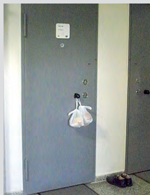
Tür zu, Behandlung ade.

Wer als Politiker den Gedanken an Personalkürzungen nachhängt, der gelangt schnell vom Holzweg in die Sackgasse.