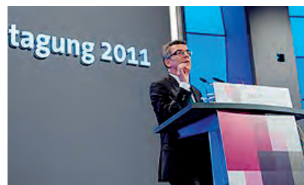
Bundesinnenminister Thomas de Maizière.

Auch wenn das Thema auf den ersten Blick vielleicht etwas weit weg erscheint vom Vollzugsalltag, wissen wir doch alle, dass sich hier direkte Verknüpfungen ergeben. Denn auch im Vollzug ist ohne Moos nichts los. Auf die konkrete Wiedergabe der Diskussion soll hier wegen des inhaltlichen Umfangs verzichtet werden. Ausführliche Beiträge finden sich auf der Internetseite www.dbb.de .