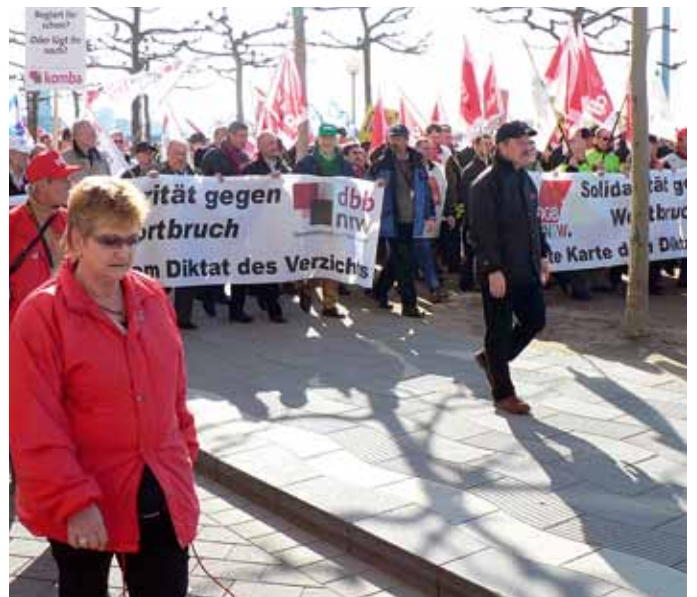
Was sich als Kooperationsmodell bei den Tarifverhandlungen bewährt, ist oft nicht frei von Konflikten.