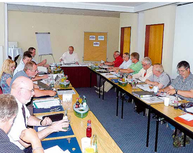
Die Mitglieder des BSBD-Hauptvorstandes bereiteten die Organisation des Bundesgewerkschaftstages 2011 vor.