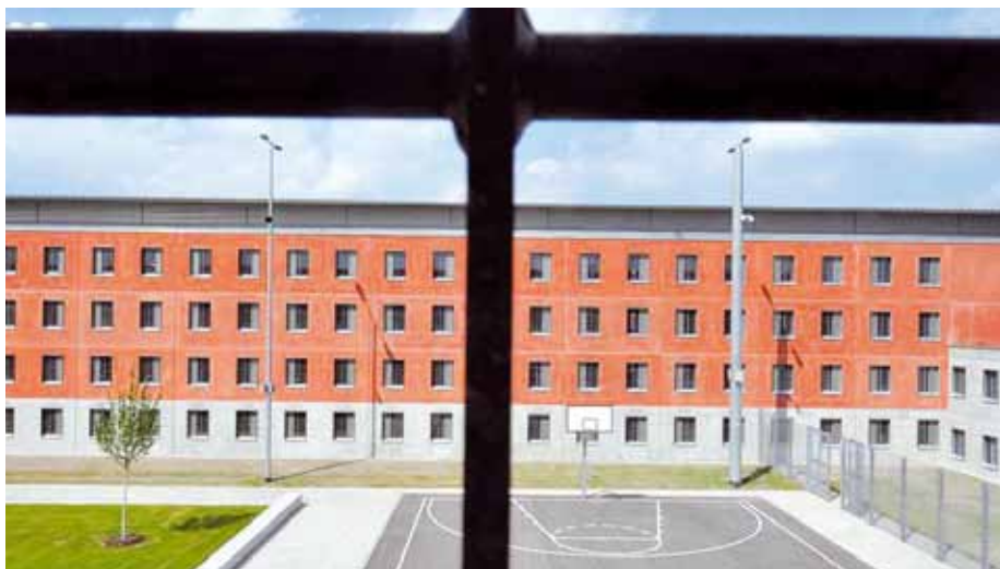
Die grün-rote Koalition will das neoliberale Experiment der Vorgängerregierung, die Teilprivatisierung der JVA Offenburg, zeitnah durch Kündigung der Verträge beenden.

Damit hat sich die Bevölkerung im Gegensatz zur Politik ein sicheres Gespür dafür bewahrt, bei wem sich ihre Sicherheit und die Effektivität des Strafvollzuges in den besten Händen befindet!“, forderte BSBD -Chef Anton Bachl die Politik zur Rückbesinnung auf ihre eigentlichen Aufgaben auf.