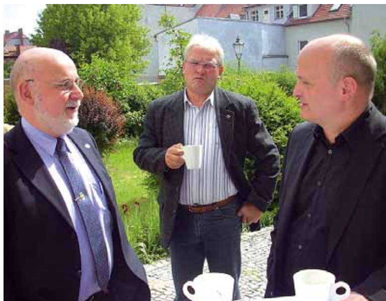
Auch in der Pause ist der Justizminister nicht vom Thema Strafvollzug abzubringen.

Deshalb müssen wir unsere Zusammenarbeit auf der Bundesebene weiter verstärken, um unsere Schlagkraft zu erhöhen und um kleinere Landesverbände sachgerecht beraten und unterstützen zu können.